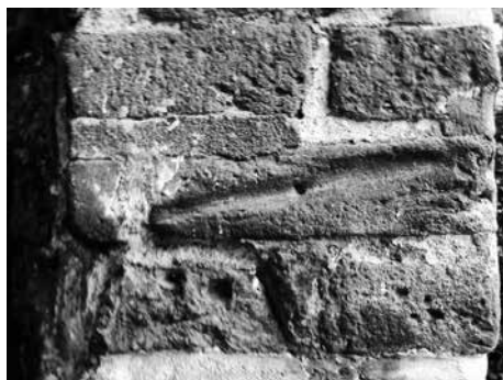
Fot. 2. Ślad podłużny na tczewskiej Farze